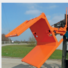
Spécial avec caisse tôle