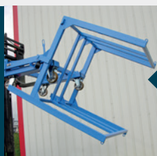
Version sur roues en position basculée