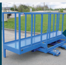
Spécial grande largeur