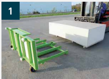
1 Chargement des plaques sur le chariot