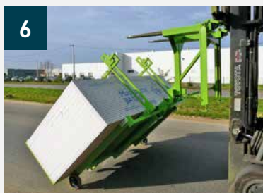
6 Basculement du chariot à la verticale, 4 patins PEHD évitant marquage au sol