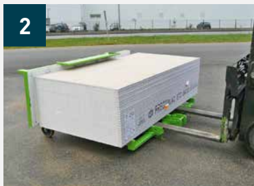
2 Dépose du paquet