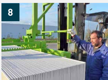
8 Clipsage du levier permettant le décrochage et retrait du palonnier