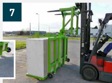
7 Chariot en position de déchargement avant retrait du palonnier PK