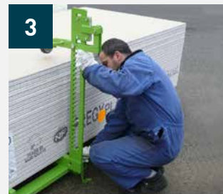
3 Pose des bras de retenue réglables