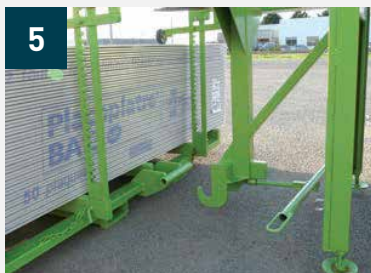
5 Préhension du chariot MP par le palonnier - Levier décliné pour verrouillage automatique du crochet sur le chariot MP sans intervention du cariste