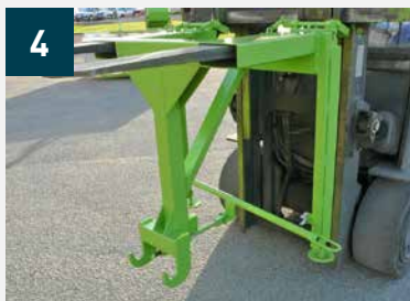
4 Prise du palonnier PK par le chariot élévateur