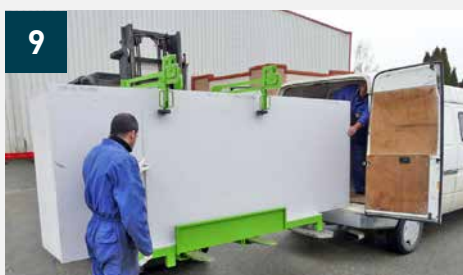
9 Chargement facilité par simple glissement des plaques vers la droite - Après distribution, bras de réglage à repositionner pour maintien des plaques restantes