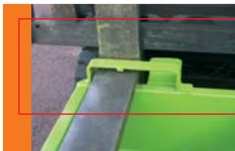
Passage des fourches