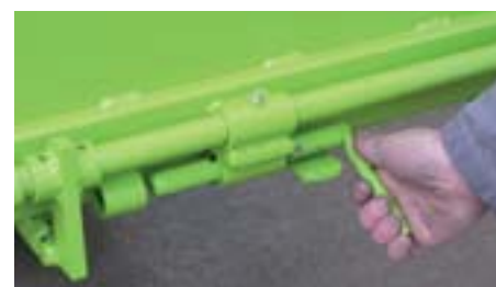
Loquet de sécurité

Ce système de sécurité indépendant de la commande d'ouverture garantit un parfait verrouillage du fond. Le loquet (en position fermée), empêche l'ouverture du fond même en cas de fausse manœuvre du cariste, par exemple lors d'une manipulation accidentelle du levier de commande.